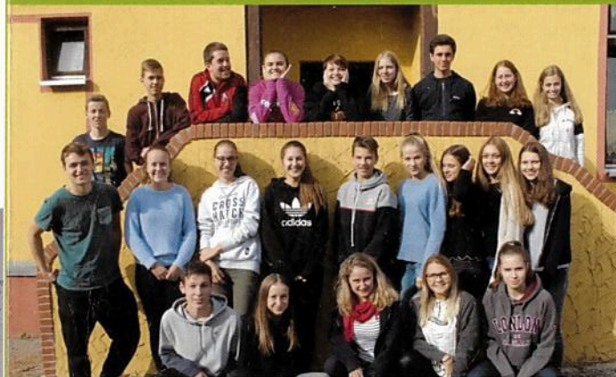
Gruppenbild des Kurs 2017 / 2018